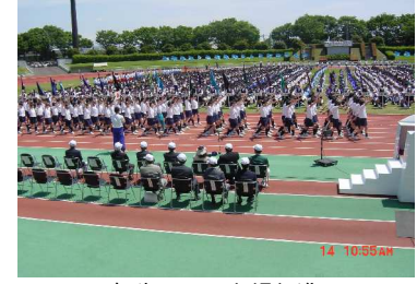
1年生による入場行進

目標設定の重要性と学習方法を学び、高校生活への展望を見出だす。沼女の生活・諸活動の在り方を研修し、各HRの発展と自覚の形成。集団生活における各自の役割を認識し、親睦を深め協力体制の形成。日程は十三日八時二十分沼田公園で出発式を行い、クラス毎に別れ、横浜少年自然の家までの十三キロの道程を励まし合いながら完歩した。昼食後入所式を行い、生徒会オリエンテーション、進路指導主事からの講話、教科別研修会を実施。夕食後は各自の決意を作文に記した。翌十四日は朝の集い、朝食後、生徒指導主事講話、体育館でのエンカウンターで盛り上がった後、昼食。午後には清掃後に校長講話を聞き、退所式後バスに分乗し帰校した。一学年の今後の活躍が大いに期待される意欲溢れる研修だった。