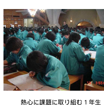
熱心に課題に取り組む1年生